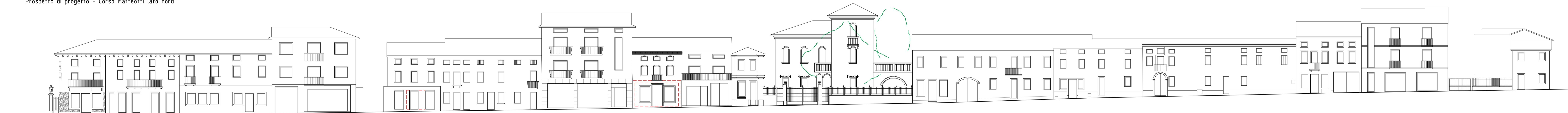
Prospetto di progetto - Corso Matteotti lato nord