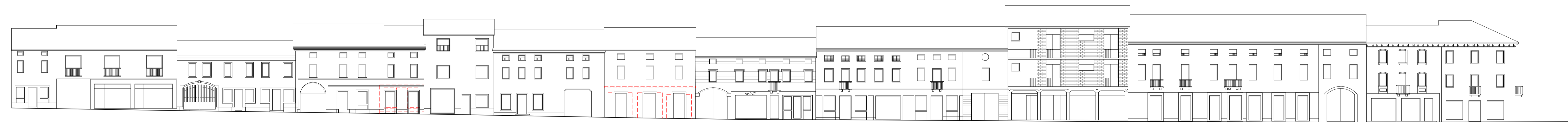
Prospetto di progetto - Corso Matteotti lato sud