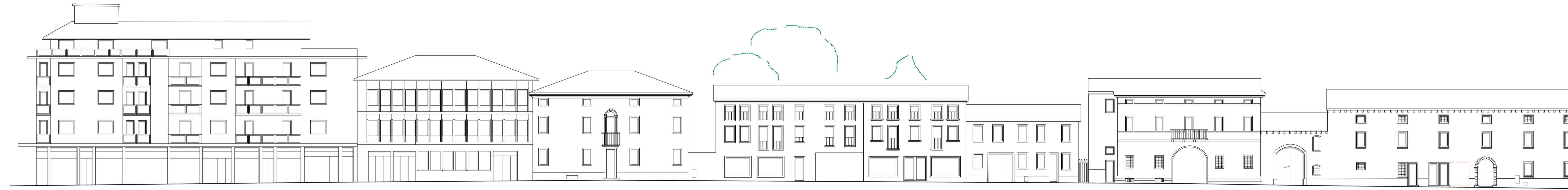
Prospetto di progetto - Corso Matteotti lato sud