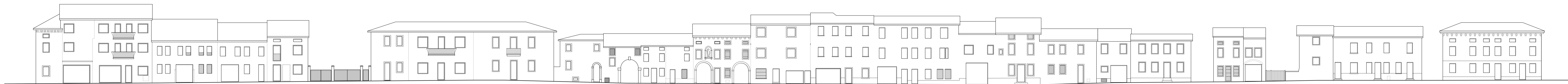
Intersezione con via Pieve